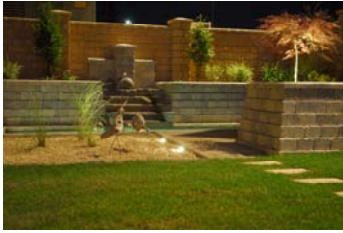
Atrium bei Nacht