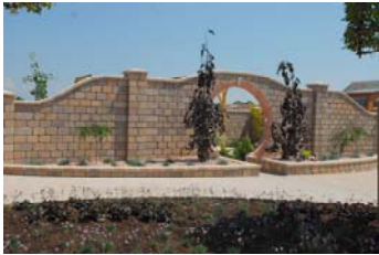
Eingang asiatischer Garten